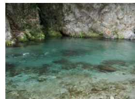
この時期だから、この色