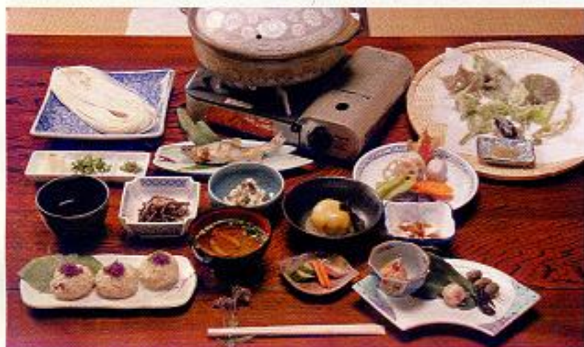
清月流薬草マクロビオティック料理と半田そうめん

古くからある料理旅館「蛍の宿 清月旅館」は、アユなどの川魚料理や、冬の柚子みそを使ったぼたん鍋などがおいしいことで知られていますが、もう一つのお勧めは、美郷の里山で若女将自らが摘み採った山野草を使った「清月流薬草マクロビオティック料理」。季節の野菜のてんぷら、煮物、あえ物、川魚の焼き魚、半田そうめんの釜揚げなどの料理に、イワタバコ、アカメガシ、クズ、ユキノシタ、ハコベ、ツユクサなど季節の山野草を使っています。