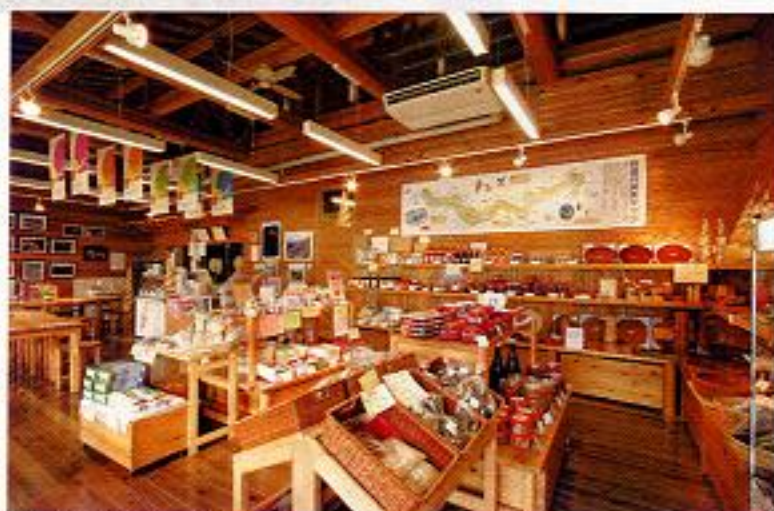
美郷の旬が揃っています

物産館には、美郷の梅や柚子、すだち等の加工品や、ホタルかご、木工品などの特産品が揃っています。