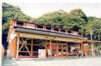
美郷物産館(赤い看板が目印)